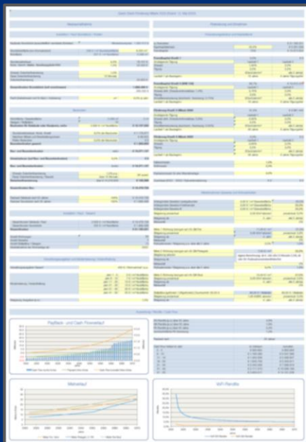
Beispiel: FB Quick Check

Die Marktveränderungen und Finanzierungspartner werden umfangreichere und genauere Kalkulationen fordern. Die GSF hat mit dem FB-Quick Check ein Instrument, Projekte und deren Finanzierung zu berechnen, zu begleiten und bei Bedarf mit Gutachten zu dokumentieren, einschließlich komplexer öffentlicher Förderung. Projektentwickler und Bauherren können somit gegenüber Finanziers, Investoren und internen Gremien schärfer und sicherer kalkulieren und stärker Transparenz schaffen.